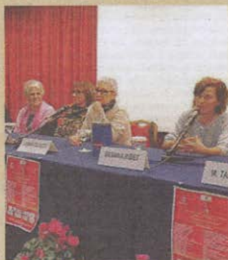
AL DELFINO Un momento del convegno

Atteso, infine, Konstantin Korotkov, docente di Biofisica all'Università di San Pietroburgo. Autore di ricerche che per oltre 40 anni hanno unito un rigoroso metodo scientifico ad un'insaziabile curiosità per le cose dello spirito e dell'anima ed un profondo rispetto per tutta la vita, Korotkov ha spiegato la tecnologia da lui applicata: la visualizzazione elettrofotonica. Permettendo la cattura, mediante una speciale apparecchiatura, dell'energia fisica, emozionale, mentale e spirituale emanata da persone, piante, liquidi, polveri e oggetti inanimati, tale tecnica è poi in grado di «leggere», attraverso l'applicazione di un modello computerizzato, i disequilibri che influenzano il benessere della persona e le loro cause. Le implicazioni per la diagnosi e la cura di condizioni fisiche, emozionali, mentali e spirituali con applicazioni in medicina, psicologia, terapia del suono, biofisica, genetica, scienza forense, agricoltura, ecologia, sono solo agli inizi.