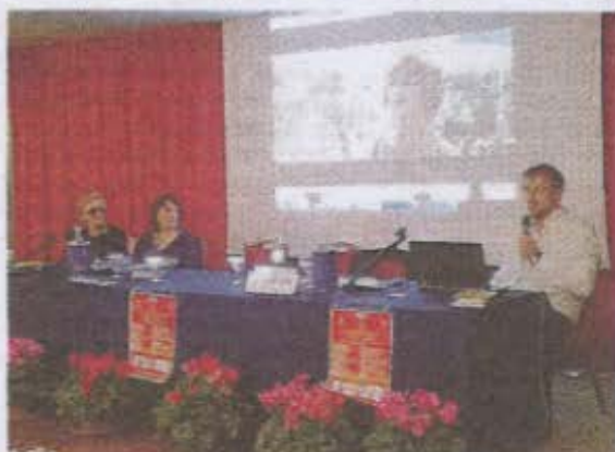
IL CONVEGNO DELLA ONLUS ieri la giornata conclusiva

tori ed esperti delle materie «di confine», intorno al grande tema della immortalità dell'uomo inteso come scintilla di quella luce divina che sopravvive al decadimento e alla morte del corpo fisico. Una nozione solo in apparenza semplice, ma che deve farsi strada a fatica in un mondo ancora troppo legato alla concezione materiale della vita. Se si riuscisse a comprendere il profondo mistero della scintilla immortale che ognuno custodisce dentro di sé, diverrebbe più «semplice» anche accettare il momento della morte, quel momento che il noto teologo e biblista padre Alberto Maggi, in videocollegamento da Ancona, aveva sabato mattina definito il modo in cui tutti noi nasciamo alla nostra vita spirituale ed eterna.