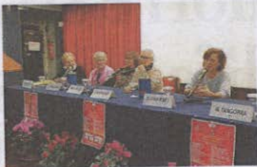
CULTURA E SPIRITUALITÀ Ieri la seconda giornata del convegno promosso da «Sopravvivenza e vita eterna»